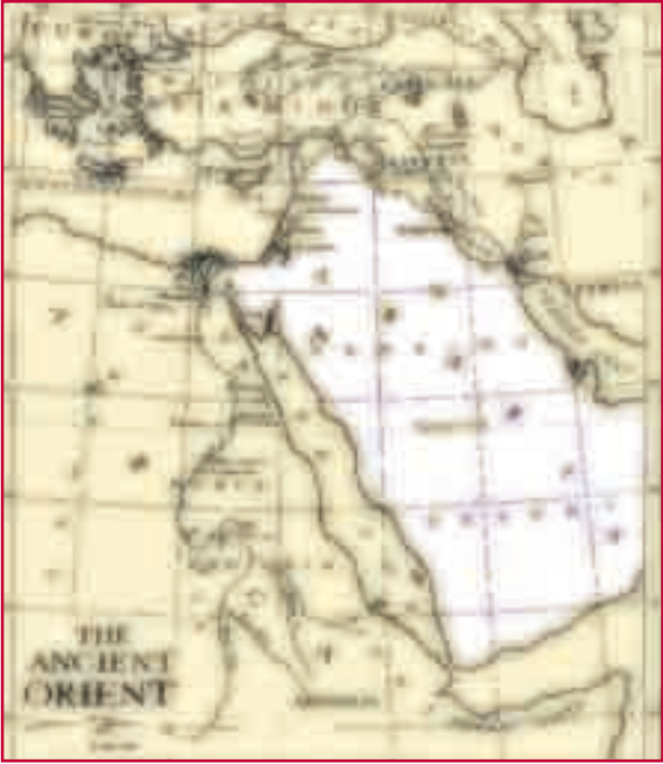
Eski Mısır haritası.

onun karakteri hakkında da bilgi vermektedir. Ayetlerde Hz. Musa'nın kişiliğine dair bilgiler verilmekte ve onun heyecanlı bir yapıya sahip olduğu anlaşılmaktadır. Kavga eden iki kişiden hemen taraftarlarından olanı tutmuş, diğerini bir yumrukla öldürmüş, öldürülmekten endişe edinerek Mısır'dan çıkmıştır. Bunları yaparken Hz. Musa'nın hep heyecan içinde olduğu görülmektedir. Fakat daha sonra Allah'ın kendisiyle konuşması ve onu eğitmesiyle Hz. Musa, Allah dışında kimseden korkmamayı ve Allah'a tam anlamıyla tevekkül etmeyi öğrenmiştir. Bu, Allah'ın bir insanın karakterini geliştirmesinin ve olgunlaştırmasının güzel bir örneğidir.